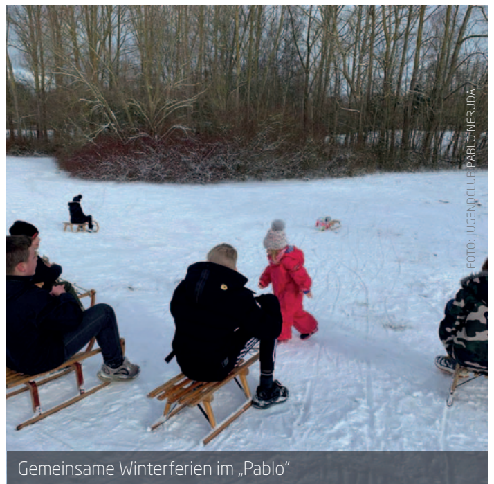
Gemeinsame Winterferien im „Pablo“