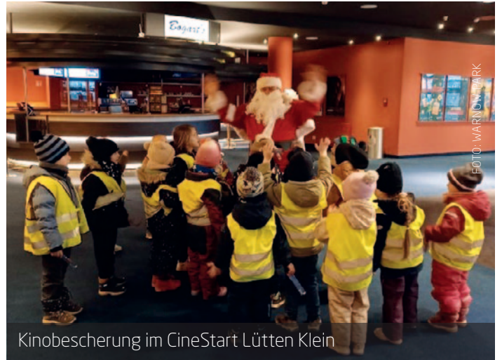
Kinobesucher im CineStar Lütten Klein

Der Leseclub findet jeden Dienstag (außer in den Ferien) von 14.30 bis 16.00 Uhr im Stadtteil- und Begegnungszentrum Evershagen (Maxim-Gorki-Str.52) statt.