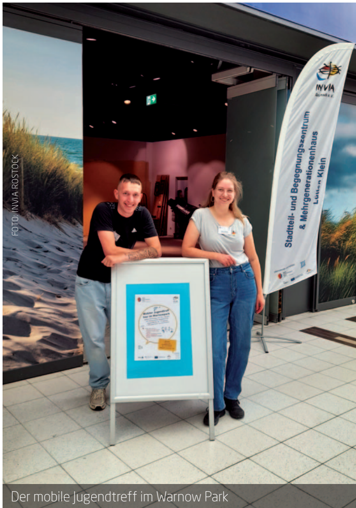
Der mobile Jugendtreff im Warnow Park

Wichtig zu wissen: Der Jugendtreff ist mobil. Das heißt, er nutzt aktuell den leerstehenden Raum, wird aber umziehen, sobald ein neues Geschäft die Fläche füllt. So bleiben wir immer in Bewegung – aber wir bleiben. Einfach vorbeischauen: jeden Dienstag von 15 bis 18 Uhr