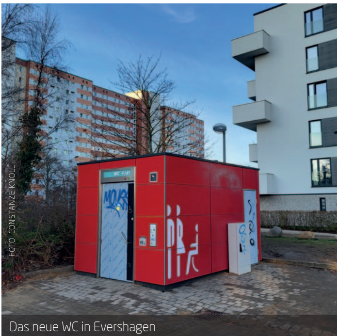
Das neue WC in Evershagen

Öffentliche WC-Anlagen sind ein oft unterschätzter Bestandteil des Alltags. Sie entscheiden darüber, wie selbstverständlich Menschen ihren Stadtteil nutzen können. Sollte sich das Projekt bewähren, könnten perspektivisch weitere Standorte folgen. Für Evershagen ist das rote Häuschen ein kleiner, aber wichtiger Schritt hin zu mehr Aufenthaltsqualität im Quartier. | Constanze Knoll