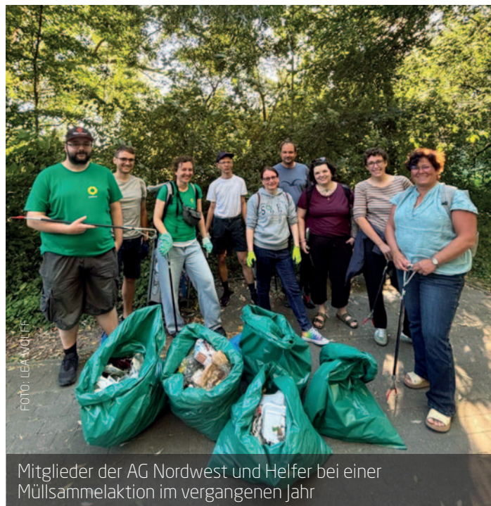
Mitglieder der AG Nordwest und Helfer bei einer Müllsammelaktion im vergangenen Jahr

Die AG Nordwest freut sich über Interessierte und freiwillige Helferinnen und Helfer. Termine sind regelmäßig im Veranstaltungskalender zu finden. Für weitere Fragen nehmen Sie gerne Kontakt unter ag-nordwest@gruene-rostock.de auf. Alle sind herzlich zum Mitmachen eingeladen.