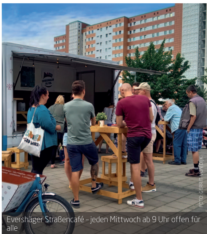
Evershäger Straßencafé – jeden Mittwoch ab 9 Uhr offen für alle

Haltepunkt E ist Teil der Stiftung Freie evangelische Gemeinde in Norddeutschland. Im Zentrum steht die Botschaft, dass jeder Mensch wertvoll ist und dass Liebe, Hoffnung und ein neuer Anfang möglich sind. Daraus wächst alles, was wir im Stadtteil tun. Weitere Informationen finden Sie unter www.haltepunkt-e.de